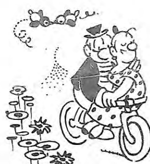
- 2 roues -