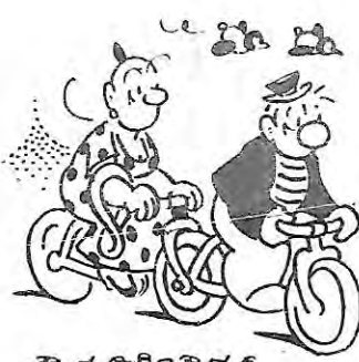
- 3 roues -