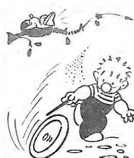
- Epilogue : 1 roue ! -