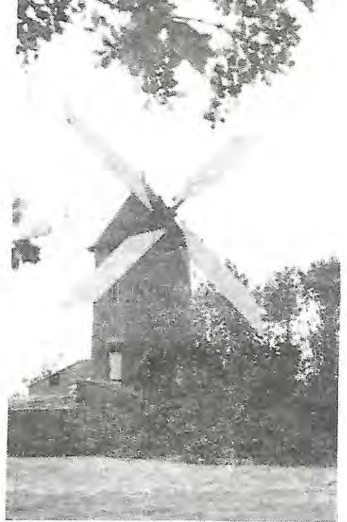
moulin des Justices

Centre Cial RALLYE 85100 LES SABLES D'OLONNE