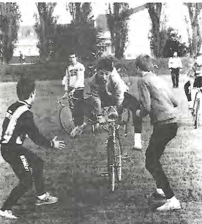
Le collège de Brécey a déjà deux classes sports-études.