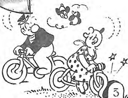
- 4 roues -