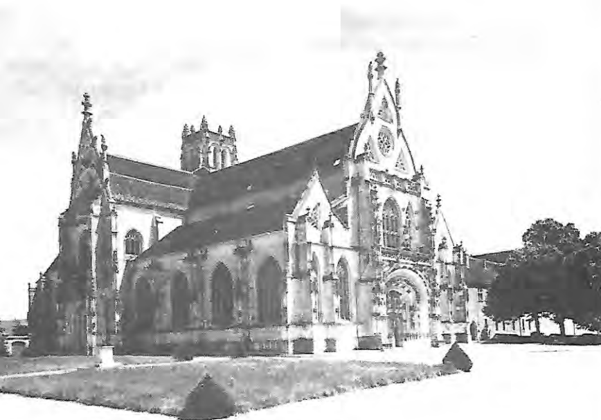
bourg-en-bresse (eglise de Brou)

Les recherches entreprises dans le fossé bordant la route sont restées vaines.