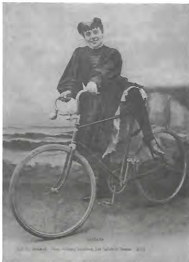
Une charmante sablaise qui savait pédaler sans contrainte... C'était il y a bien longtemps.