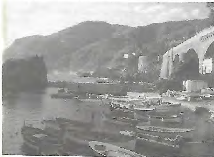
Framura - Le petit Port