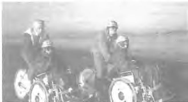
Le monopousseur inventé par un résident du foyer de vie René Bonnet de Tonneins.

En décembre dernier, une étrange caravane a parcouru en huit jours les 650 km qui séparent la petite ville de Tonneins, dans le Lot et Garonne, de la capitale. Neuf handicapés et neuf valides aimant pédaler se sont relayés sur trois "monopousseurs". Ni plus, ni moins qu'une bicyclette dont le guidon et la roue avant ont été remplacés par un fauteuil roulant. Sept étapes journalières de 80 à 100 km ont permis à ces sportifs d'être à l'heure sur le plateau d'Antenne 2 pour le dernier téléthon. L'équipe doyenne totalisait 138 ans.