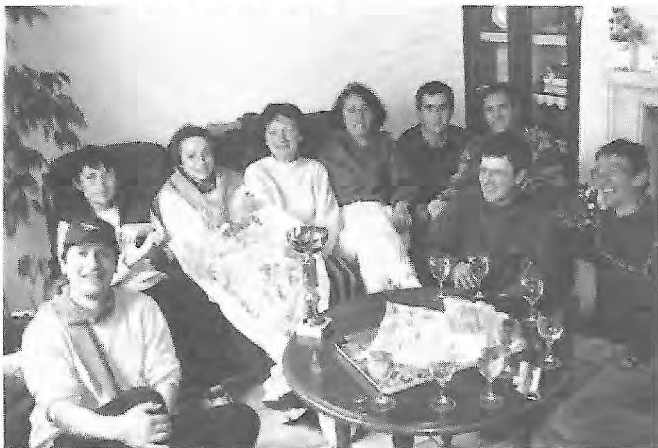
Au retour de Guérande, les kilomètres n'avaient pas usé la bonne humeur du groupe.