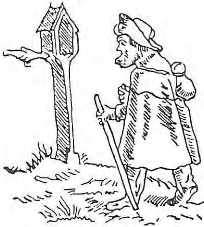
dessin de H. Holbein - fin XV e s.

Ce relais est le premier élément d'un programme ambitieux. Un bâtiment du XVIIe-XVIIIe acquis cette année complètera ce site. Dans ses murs, une aumônerie va être reconstituée. Pour faire revivre les techniques anciennes, un atelier bois y a été aménagé. Ouvert, il propose une collection importante d'outils de menuisier. D'autres animations figurent dans les dossiers du district de Palluau, telle une auberge dans une ambiance du XVIIe offrant des mets rustiques servis par un personnel en costume. Deux espaces cultivés, l'un en plantes médicinales semblables à celles du Moyen-Age, l'autre en plantes légumières spécifiques à la même époque, complèteront ces créations. Créations auxquelles il convient d'adjoindre l'aménagement d'un gîte d'étape.