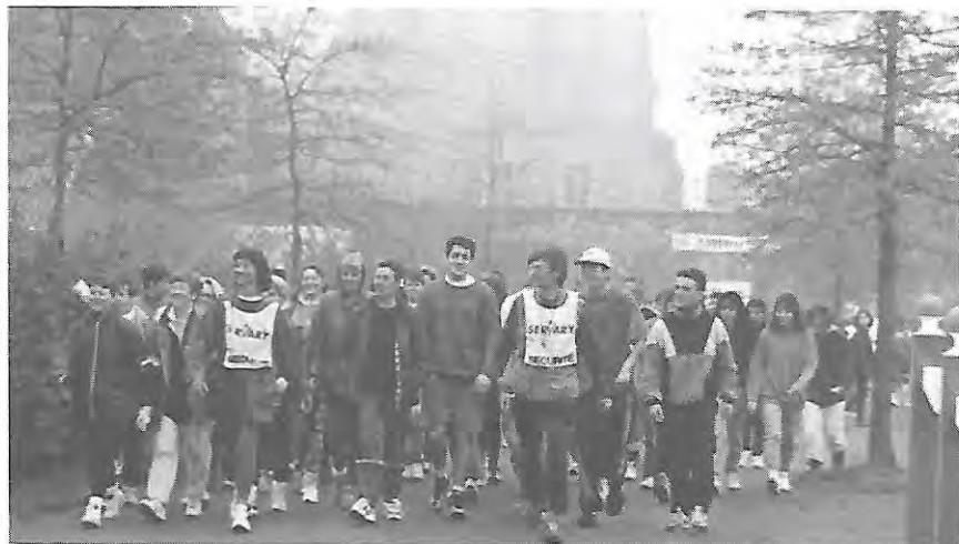
Entre le premier groupe parti dès 8h10 de la cour du château...