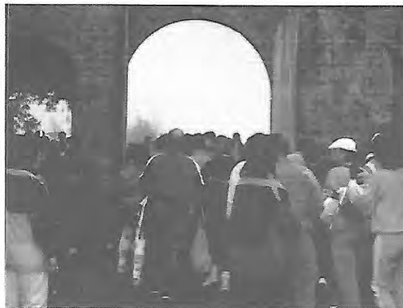
... et les derniers inscrits qui se sont mis en route vingt minutes plus tard, il y avait plus de 1.300 marcheurs comme celui ci-dessous...

A.C.B.V. et C.T.H. doivent un grand merci à J.M. Delahaye président de l'association du Puy du Fou, qui a offert plus de 1.800 entrées au Grand Parcours à chacun des arrivants. Dans le succès tout le monde s'y retrouve. Pour 1997, les deux clubs organisateurs sont à nouveau partants. Pour les marcheurs, un Brevet Audax de 25 km sera proposé. La date du 8 mai (très probable) est d'ores et déjà bloquée au calendrier national.