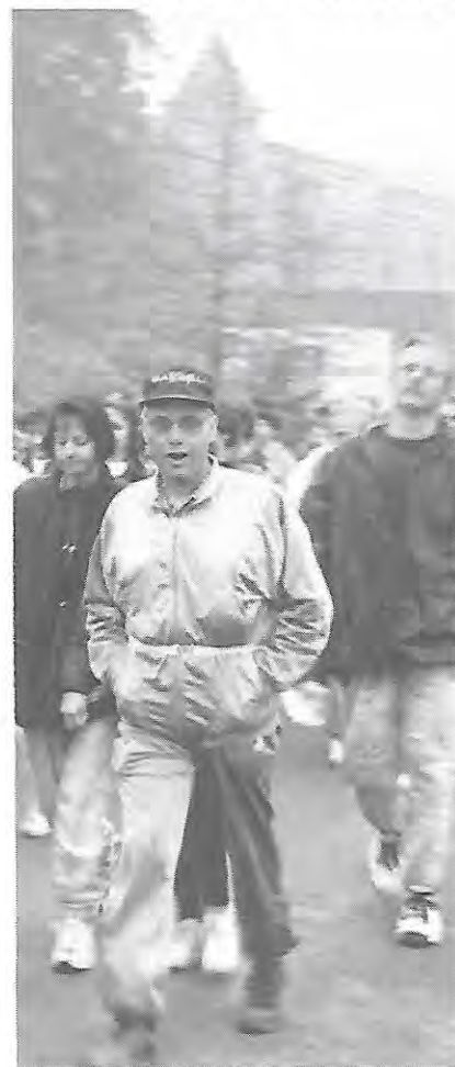
... peut-être pas aussi "affûtés" que le Président du CODEP 44 Cyclotourisme, un Aigle d'Or Audax marche que l'on ne présente plus!