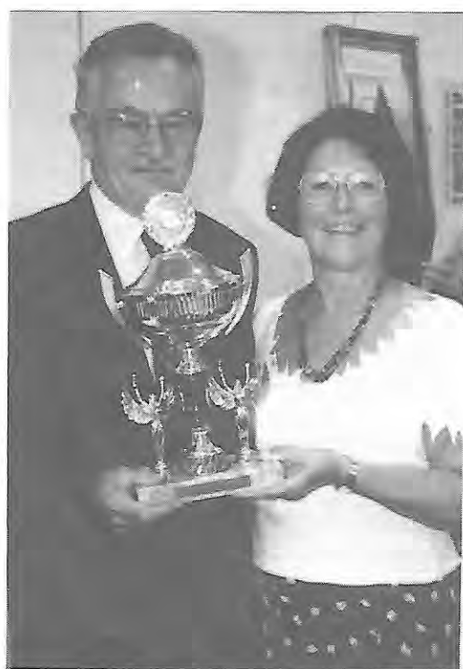
Une présidente d'O.M.S. aux anges et un récipiendaire ému !