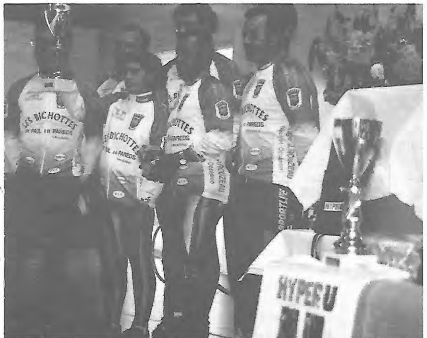
L'équipe des Bichottes de Saint Paul en Pareds a remporté la coupe du nombre en VTT