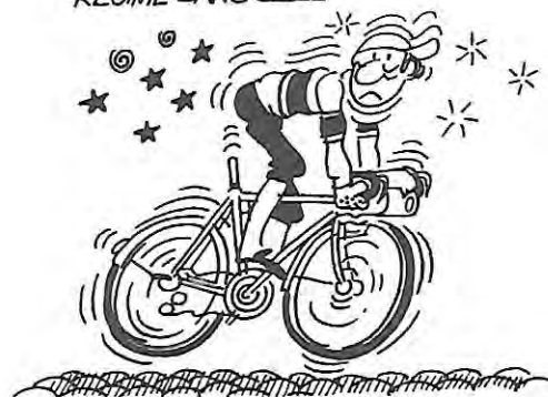
RÉGIME SANS SELLE

■ SEMAINES FEDERALES. - Cette année la S.F. aura lieu à Albertville. En 1998, c'est Charleville-Mézières qui accueillera les cyclos. A suivre, 1999 Rennes et Bourg en-Bresse pour l'an 2000