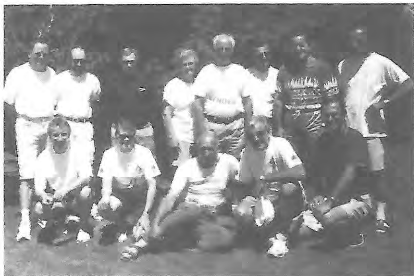
Avant le départ, l'équipe au complet avec ses accompagnateurs.