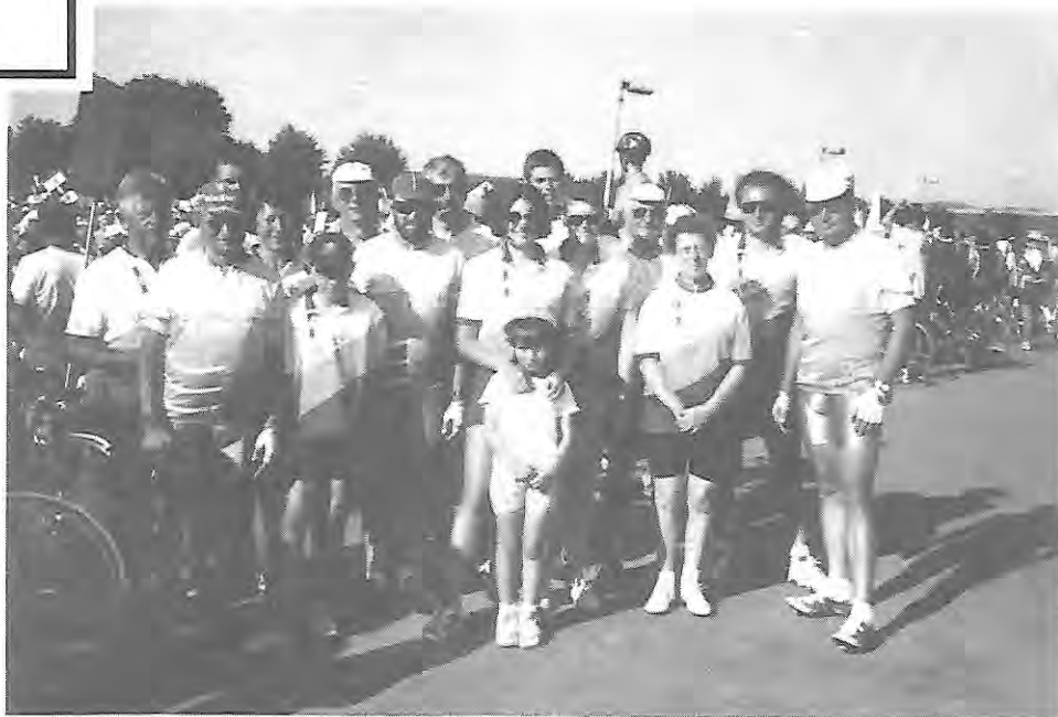
C.T.H. Les Herbiers Vendée. Les maillots du club ont été présents sur tous les circuits de la Semaine. Tous ensemble pour le défilé de clôture

L'an prochain, ce sera en Pays Breton. A Rennes. Les bénévoles de l'Ouest feront tout pour réussir leur pari d'accueillir un peloton encore plus étoffé. Ceux qui ont "fait" Guingamp il y a quelques années vous engagent à venir voir comme la Bretagne est belle!