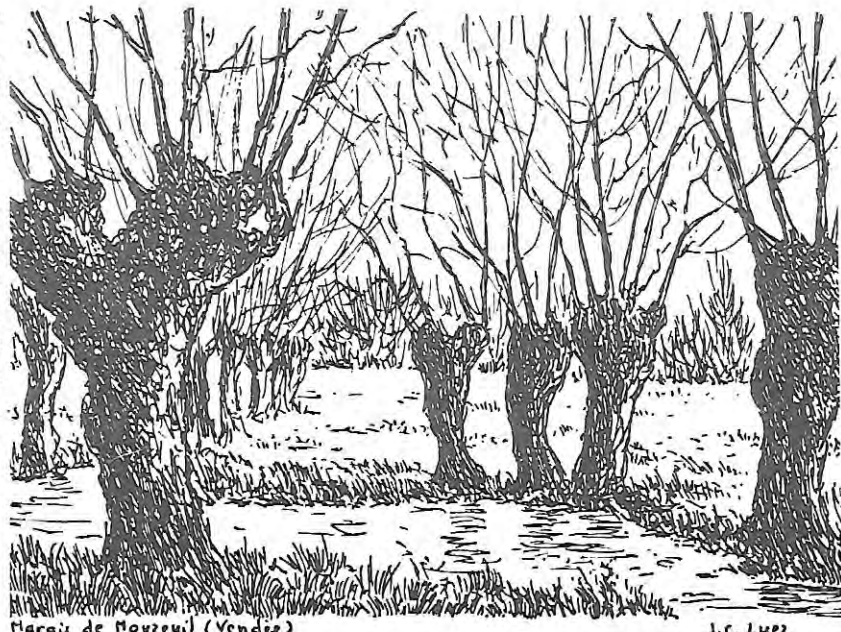
Marais de Nouzeuil (Vendée)