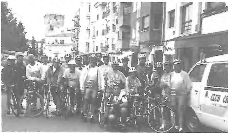
Les cyclos du club Ciclista Coriense nous ont offert de les accompagner lors de leur sortie dominicale.

Le cyclotourisme est un sport de loisir. Ni plus ni moins que les autres sports pratiqués par des licenciés qui n'en font pas profession, mais là n'est pas le sujet. Une chose est sûre, c'est que nous n'avons ni stade ni tribunes, pas de salle équipée de gradins, et pas de spectateurs. Si l'on veut être connus et reconnus, il ne faut pas hésiter à sauter sur chaque occasion qui nous est donnée de faire découvrir notre discipline.