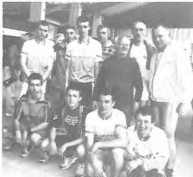
Quelques membres du groupe VTT

Les tarifs éventuels indiqués vous permettent de vous restaurer aux ravitos, à l'arrivée de chaque sortie, de disposer de douches et de laver les montures si nécessaire.