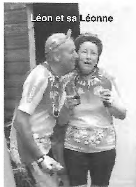
Léon et sa Léonne