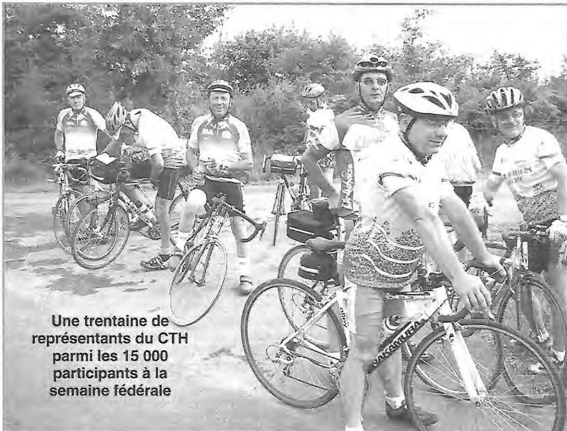
Une trentaine de représentants du CTH parmi les 15 000 participants à la semaine fédérale

Qu'il soit pourpre, noir, blanc ou vert, le Périgord est généreux dans la diversité de ses reliefs qu'ont découverts les 15000 cyclistes à la semaine fédérale du 5 au 11 août 2007.