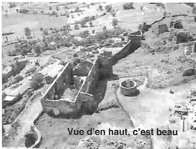
Vue d'en haut, c'est beau

Muni de l'éclairage obligatoire, c'est à 3h00 du matin qu'il s'élance direction la Croix