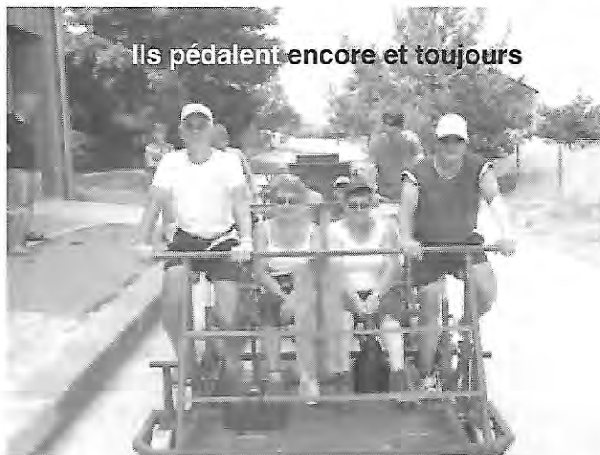
Ils pédalent encore et toujours

de Fer, en guise de mise en jambe. Très vite le peloton s'étire formant un long défilé de feux rouges. Au petit jour le paysage est grandiose, nous surplombons le lac de Grandmaison, passons au pied du Glandon et finissons par la montée de la Croix de Fer dans un silence total ; impressionnant. Le col du Hollard nous attend avant la descente sur la vallée de Maurienne. Après un bon ravitaillement, Le Télégraphe puis Le Roi Galibier et son décor somptueux, marque la fin de nos souffrances. En effet les 70 km restants ne sont pratiquement constitués que de descentes. Heureusement d'ailleurs car la moindre petite côte ou faux-plat réveille les douleurs dans les cuisses. Pour nous qui sommes restés aux Herbiers, parions que nous aurons fort à faire pour suivre nos deux compères qui reviendront hyper affûtés de leur périple en haute altitude.