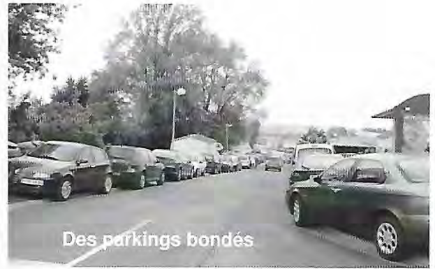
Des parkings bondés

Dans de nombreuses croyances, le nombre 13 est synonyme de malheur. A l'origine de cette superstition se trouvent de très nombreux événements religieux ou historiques comme par exemple, la 13 ème lettre de l'alphabet hébreux (mem) qui s'apparenterait à la mort, Judas (l'apôtre) était le 13 ème homme présent au dernier repas de Jésus (la Cène), au tarot la treizième arcanne représente un squelette en train de faucher, etc. En France, la malchance (ou la chance pour certains) du Vendredi 13 viendrait du vendredi 13 Octobre 1307, jour où tous les Templiers de France ont été arrêtés et interrogés sous la torture par les sénéchaux et les baillis du royaume. Il n'y a pas de voiture N°13 en Formule 1, ni de chambre 13 dans de nombreux hôtels. La peur du nombre 13 s'appelle la triskaidékaphobie .