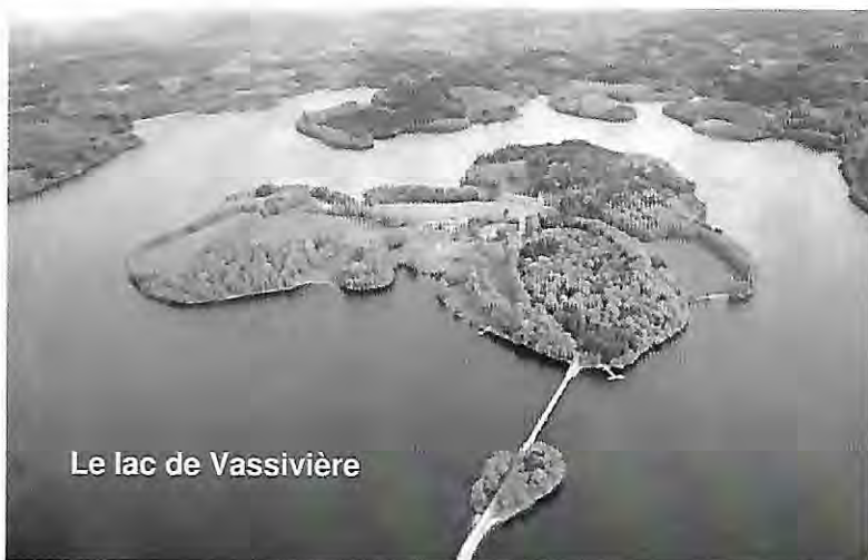
Le lac de Vassivière