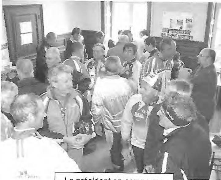
Le président en campagne

Au-delà de la courtoisie, des matins de randonnées et de l'intégration des néophytes dans le sillage des plus aguerris, le comité avait décidé cette année, pour le second thème d'y consacrer un dimanche matin. Ce serait donc le 8 février. Curieusement, ayant assisté à la même réunion du bureau, les mystères de la communication font que nous n'étions pas tous accordés sur la même longueur d'ondes.