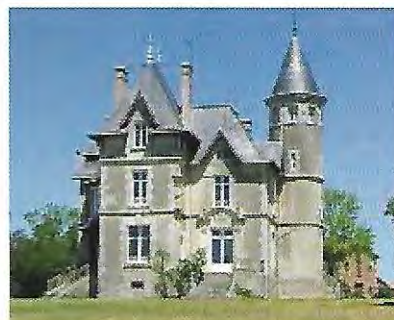
Le Domaine de Brédurière

Avec 30 participants notre club était le mieux représenté... C'est bien parti pour le challenge 2009 et il reste encore vingt randonnées pour conforter cette première place !