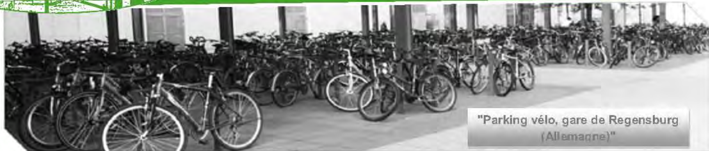
"Parking vélo, gare de Regensburg (Allemagne)"

Expliquer aux cyclotouristes que le vélo c'est fun est une « lapalissade ». Les 132 licenciés que nous sommes au CTH, cyclotouristes ou vététistes, savent bien que le vélo leur est indispensable pour des raisons qui sont propres à chacun d'eux : avoir une activité physique soutenue pour se sentir en forme, goûter le plaisir d'être dans la nature sur nos routes de campagne ou bien dans les chemins de notre bocage, partager des moments de convivialité entre amis, découvrir de nouveaux horizons tout près de chez soi, ou dans d'autres régions et puis bien sûr satisfaire son besoin d'exprimer sa compétitivité vis-à-vis de ses compagnons de route... ou tout simplement se lancer dans des défis extrêmes tels les 1200 km des Paris-Brest-Paris en 90 heures.