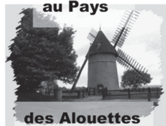
au Pays des Alouettes