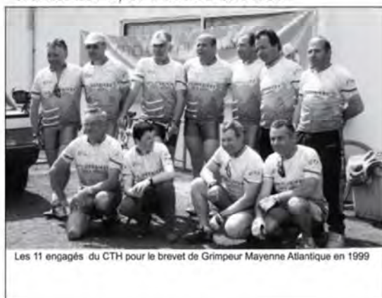
Les 11 engagés du CTH pour le brevet de Grimpeur Mayenne Atlantique en 1999