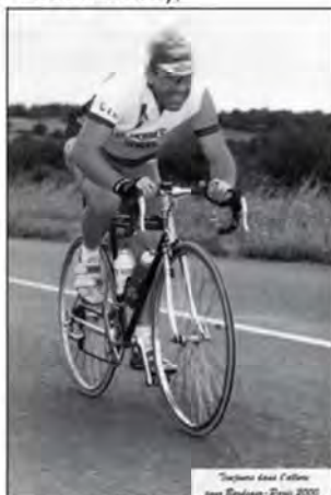
Souvenir dans l'effort sur Bordeaux-Paris 2000