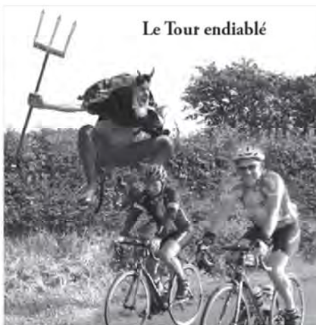
Le Tour endiablé