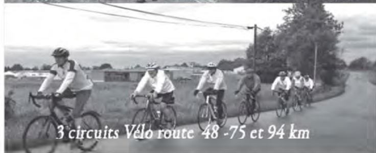
3 circuits Vélo route 48 -75 et 94 km

Comme chaque année, le club a besoin de votre participation pour le bon déroulement de la manifestation, donc rendez-vous à vos postes habituels et à la mise en place le samedi 7 mai 2016.