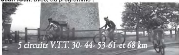
5 circuits V.T.T. 30- 44- 53-61-et 68 km

Mais ce n'est évidemment pas cela qui va freiner l'élan et le dynamisme de notre club, des uns et des autres, pour préparer ce grand rendez-vous avec tout son programme habituel. Pour la 5 ème année, le départ et l'arrivée se situeront sur le site du Lycée Jean XXIII , avec, au programme :