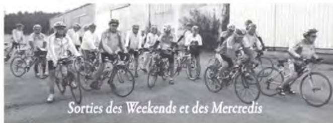
Sorties des Weekends et des Mercredis

Comme chaque année, le club a besoin de votre participation pour le bon déroulement de la manifestation, donc rendez-vous à vos postes habituels et à la mise en place le samedi 7 mai 2016.