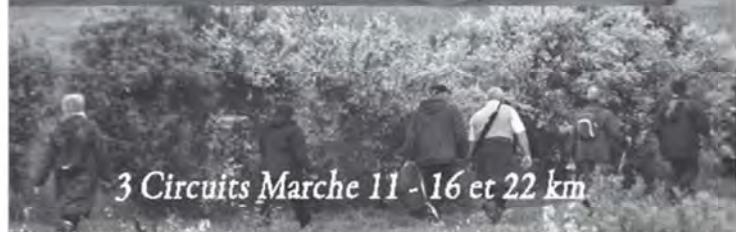
3 Circuits Marche 11 -16 et 22 km