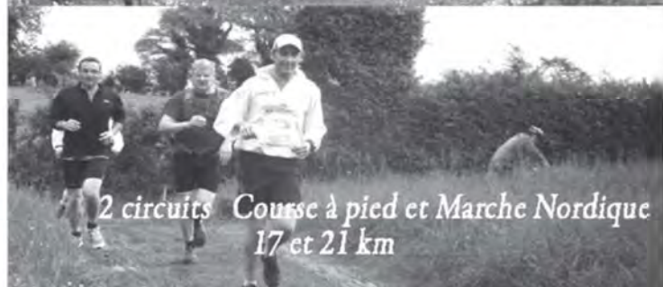
2 circuits Course à pied et Marche Nordique 17 et 21 km