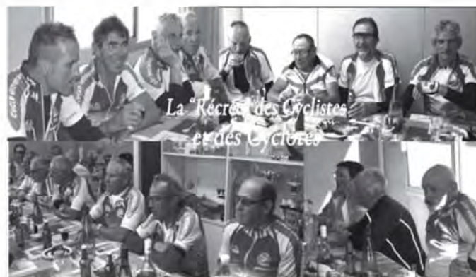
La "Récré" des Cyclistes et des Cycloïres