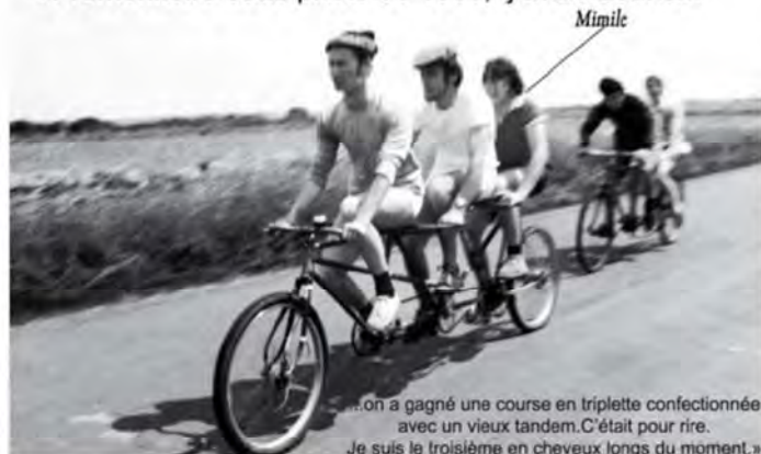
« on a gagné une course en triplette confectionnée avec un vieux tandem. C'était pour rire. Je suis le troisième en cheveux longs du moment. »

«Prémonitoire cette photo de 1968, j'avais 20ans...»