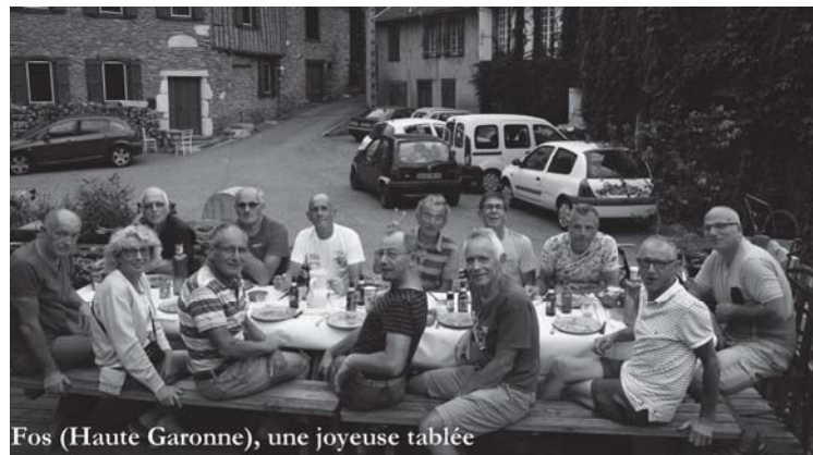
Fos (Haute Garonne), une joyeuse tablée