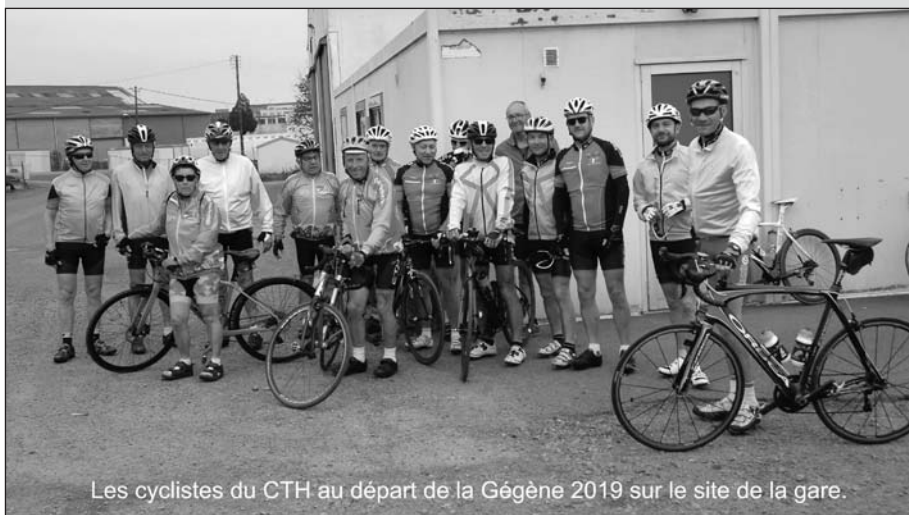
Les cyclistes du CTH au départ de la Gégène 2019 sur le site de la gare.