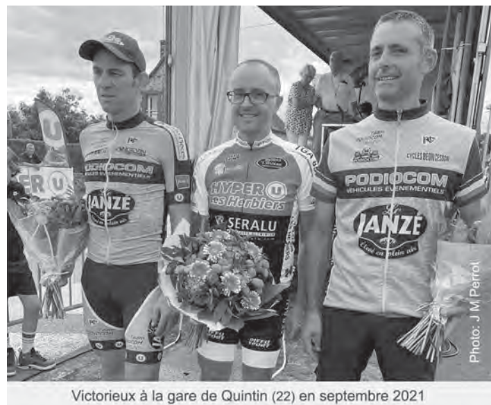
Victorieux à la gare de Quintin (22) en septembre 2021

- J'aime le vélo depuis 5 ou 6 ans je faisais des sorties de 50km comptant 2500 à 2800 km par années. En 2021 contre toute attente j'ai repris une licence de compétition