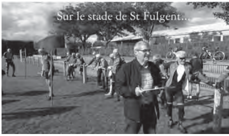
Sur le stade de St Fulgent...