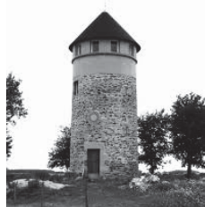
MOULIN DE LA BLEURE - CHAVAGNES EN PAILLERS

Les Herbiers/ L'Aurière Mesnard/ La Tricherie Vendrennes/ St Fulgent La Lérandière/La Chaunière Direction Chavagnes en Pailiers Le Coin 1 er A /d MorinièreA/D L'Hôpital/ Château d'eau Le Plessis des Landes Pailiers /la Blaconnière A/d Beaurepaire /La Lande Les Peux/ Les Herbiers