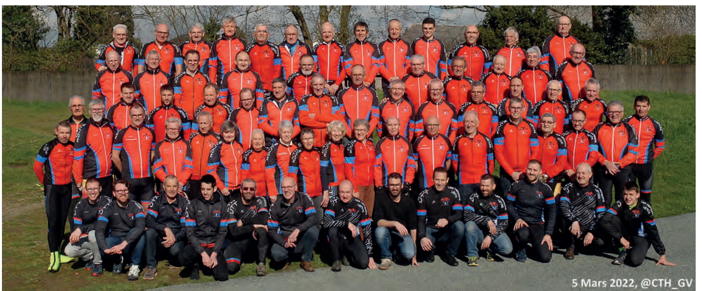
5 Mars 2022, @CTH_GV

Le CTH vient de rédiger son projet associatif qui repose sur des valeurs sportives et humaines qui n'ont d'autre vocation que de tisser un lien associatif et participatif au service des habitants du Pays des Herbiers.