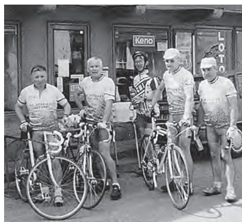
Brevet des Grimpeurs - 1999