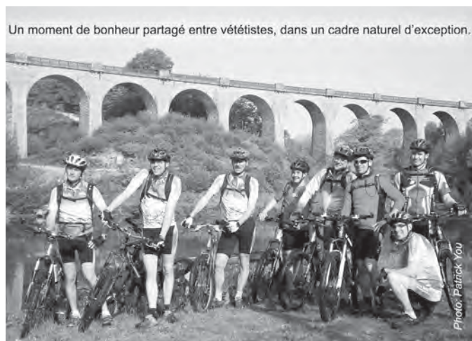
Un moment de bonheur partagé entre vététistes, dans un cadre naturel d'exception.